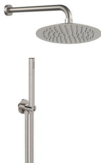
IMMAGINE - IMAGE