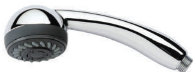
IMMAGINE - IMAGE