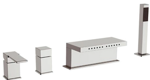
IMMAGINE - IMAGE