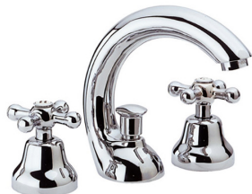
IMMAGINE - IMAGE